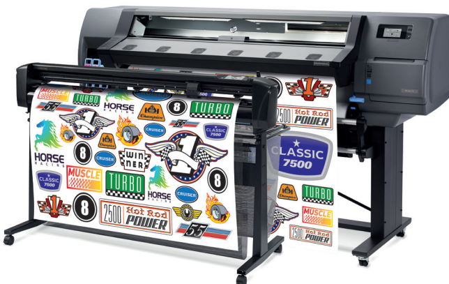
Neuer, günstiger Einstieg: Latex 115 für kleine Volumen, auch als Print & Cut

Positiv überraschend sind die Preise für die Bundles: der Wert von Schneideplotter und Software spiegelt sich im Aufpreis längst nicht wieder. Trotz weit besserer Softwareausstattung und hochwertigerem Schneideplotter liegen die Preise im Rahmen der Hybridkonkurrenz, und auch vor nahezu allen Drucklösungen mit separaten Geräten. Details zu den Latexdruckern gibt es auf www.latex300.ch .