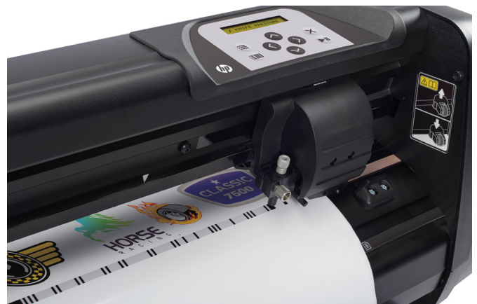
Per Barcode: der Plotter identifiziert und lädt die passende Konturschnittdatei

Aufpreis vom reinen Drucker absolute Schnäppchen sind. Die mitgelieferte Software FlexiPRINT & CUT ist überraschenderweise keine reine RIP-Version mit Konturschnitt, sondern ein komplettes Programmpaket aus Designsoftware und RIP, auch mit Folienplot-Funktionen, Text- und Grafikgestaltung, Vektorisierung und vielem mehr, wie es als FlexiSIGN-PRO oder FlexiSIGN & PRINT (seit Version 12) in vielen Schweizer Grafikateliers als Design- und Plotsoftware genutzt wird. Damit liefert HP ein komplettes Starterpaket für einen Werbetechnik-Betrieb, mit interessanten Funktionen