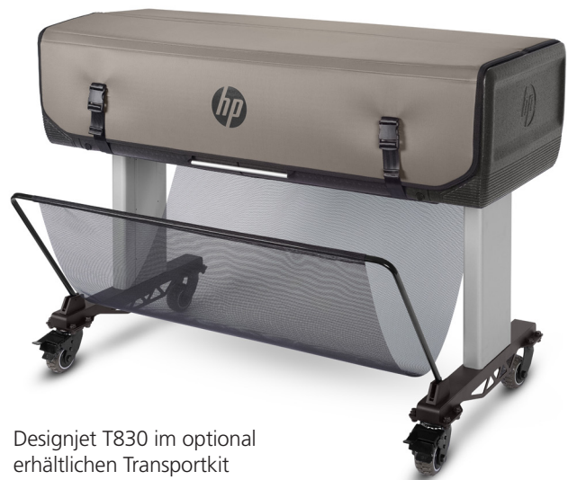
Designjet T830 im optional erhältlichen Transportkit

sind Werte die sich sehen lassen können. Gedruckt und gescannt werden kann über PC und Mac, aber auch vom Smartphone oder Tablet, eingescannte Pläne können über das integrierte Bedienfeld per E-Mail versendet oder in die Cloud gespeichert werden. Die kostenlose HP Click-Software für Mac und PC optimiert zusätzlich den Druckmedieneinsatz mit automatischem Verschachteln, drehen, manuellem Ausrichten und Neuordnung von Seiten. Der Designjet T830 ist in zwei Versionen mit 610mm oder 914mm Medienbreite verfügbar.